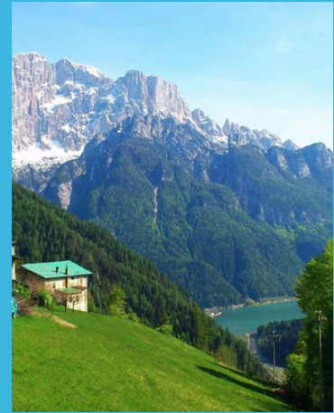
Hotel La Montanina & Hotel Coldai