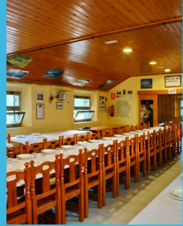
Refugi de la Renclusa